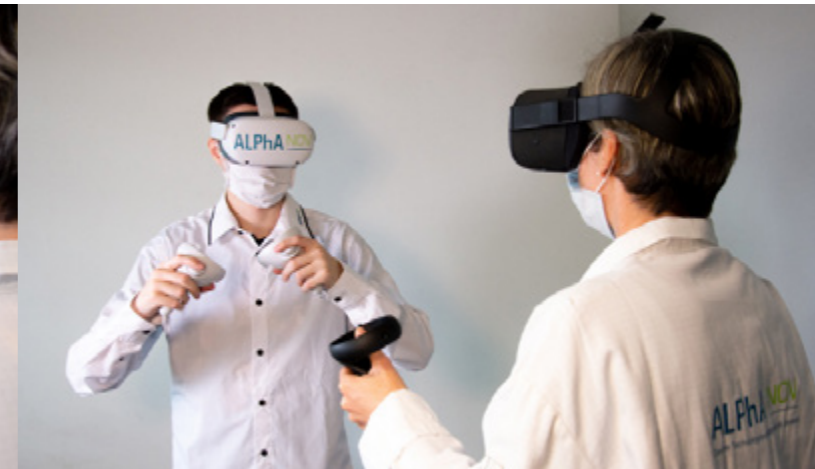
Assistance et supervision à distance avec le mode «multi-joueurs».