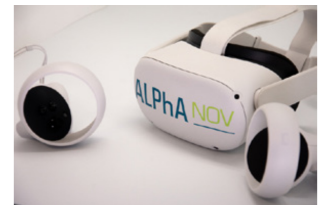
Casque de réalité virtuelle autonome.