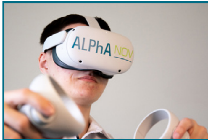
Casque de réalité virtuelle.

L'Immersive Photonics Lab est un outil de formation innovant qui embarque l'apprenant dans un laboratoire photonique en réalité virtuelle. Cet apprentissage immersif lui permet de maîtriser les gestes techniques professionnels dont votre entreprise a besoin.