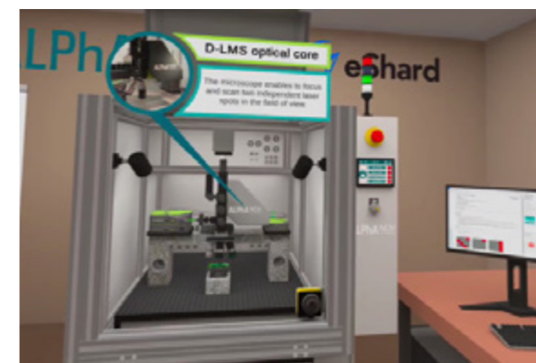
Système photonique reproduit sur mesure.