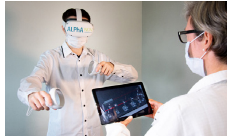
Supervision via tablette.